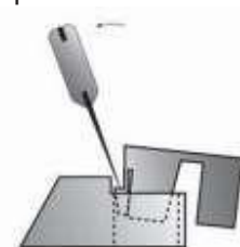
Incline la espátula para permitir que el azulejo se desenganche.

Si sólo hay restos secos y móviles en los intersticios de las baldosas , realice una limpieza básica de las baldosas .