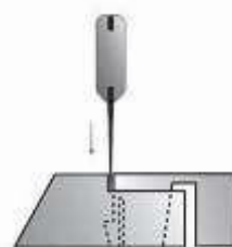
Introduzca la espátula rígida entre los ojales.

Para retirar las baldosas, introduzca la espátula rígida entre los ojales e inclínela para permitir que la baldosa se desenganche.